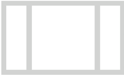
1:1 Vorlage auf Seite 2